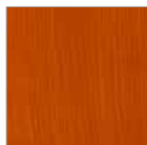
F-BR 9025 redwood