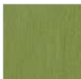
F-GR 9053 moosgrün