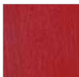
F-RR 9037 rot