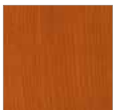
F-BR 9030 mahagoni