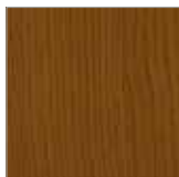
F-BR 9024 palisander