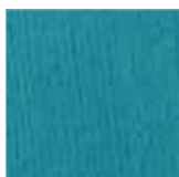
F-BT 9046 enzianblau