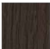
F-SW 9004 ebenholz