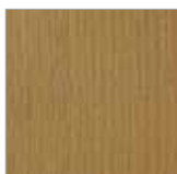
F-BR 9028 eiche dunkel