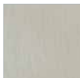
F-SW 9002 grau