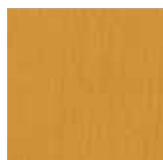
F-BR 9023 kiefer