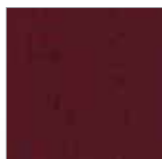
F-RR 9042 bordeaux