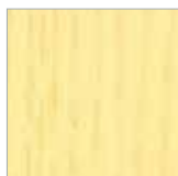
F-GO 9034 zitronengelb