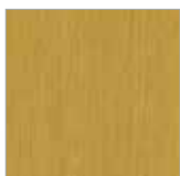
F-BR 9029 eiche hell